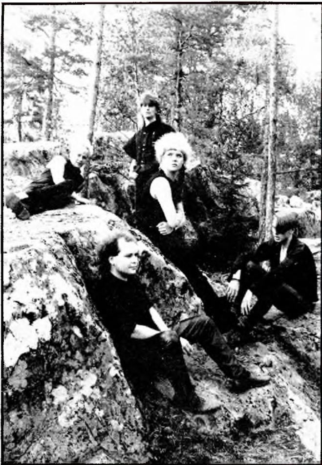
Porilainen YÖ on aikamme kovimpia rock-bändejä Suomessa. Seinäjoella yhtye esiintyy yhdessä Jim Pembroken bändin kanssa perjantaina 11.11. kello 20.00 kauppiksella.

Komea tulpakonsertti alkaa kello 20.00 Seinäjoen kauppapilaitoksella.