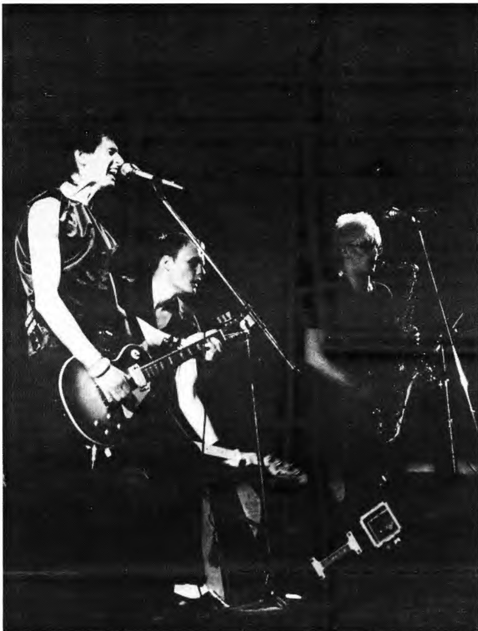
Syyskuu esiintyy 22—27.11. järjestettävällä Kemu-Tour '83 kiertueella. Bändillä on ilmestynyt single ja ke-väällä tulee Kumi-Beat-Älppäri.